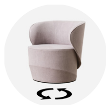
PL-SEL-002 poltrona con meccanismo girevole