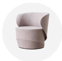
PL-SEL-000 poltrona con base fissa