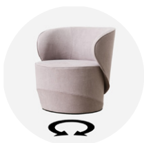
PL-SEL-003 poltrona con meccanismo girevole autoallineante