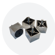
8CPI0104 M10 (x4 pz)